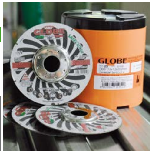
Exkluzív műanyag csomagolás 25db/ cs. Exclusive plastic packaging of 25 discs.