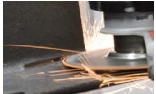
Síkba vágás a H- formájú acéloknál. Flush cutting of H-shaped steel sections.