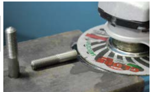
Síkba vágás a tőcsavaroknál. Flush cutting of stud bolts.